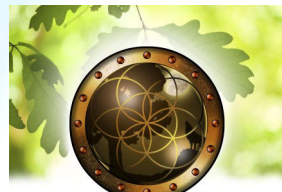
Therapeutische Praktijk Boom Praktijk voor Complementaire Natuurgeneeskunde